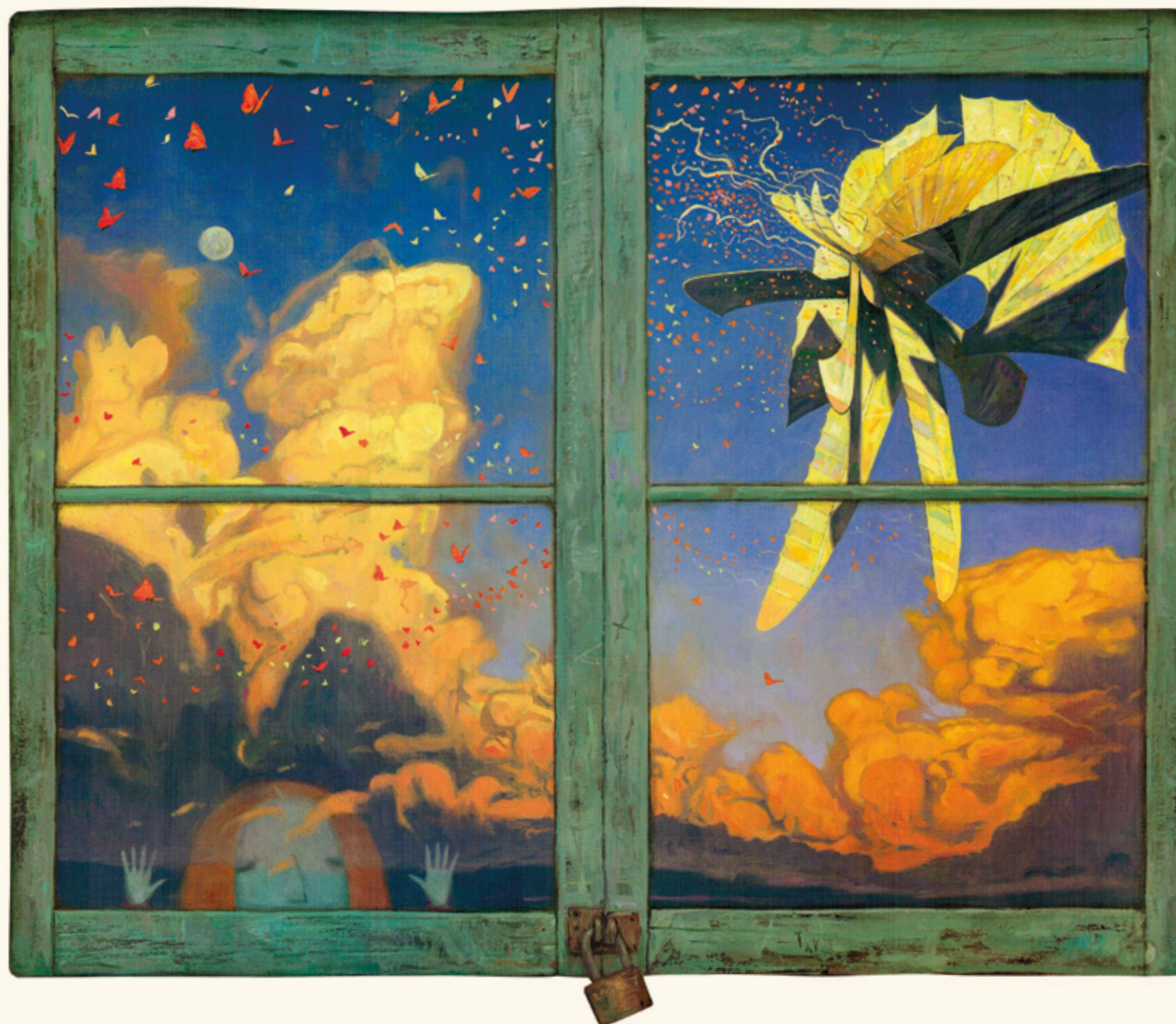
Shaun Tan, de El árbol rojo . Barbara Fiore

códigos propios del mundo del cómic. Sigue, por tanto, este esquema: 2 ilustraciones en recuadro – 3 en página y media – 1 en doble página – 1 doble página con 8 viñetas – 1 ilustración en doble página – 5 en página y media – 2 ilustraciones en recuadro. Esta simetría es un recurso brillante que acentúa el ritmo, esa monotonía casi cíclica y tan íntimamente relacionada con el tema tratado, y que lleva al lector en tensión hasta la sorpresa que supone el encuentro del árbol rojo que vemos crecer en las dos ilustraciones finales.